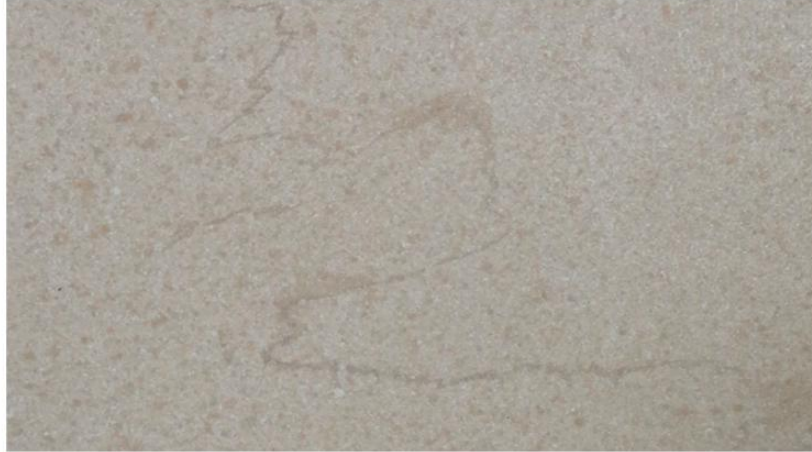
葡萄牙米黄产品展示