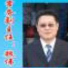
北京中航材国际文化发展有限公司