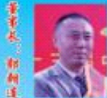
七彩贝壳集团董事局主席