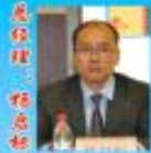
北京中航材国际文化发展有限公司