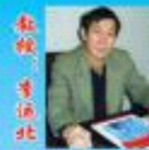
北京中航材国际文化发展有限公司