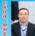
七彩贝壳集团董事局副主席